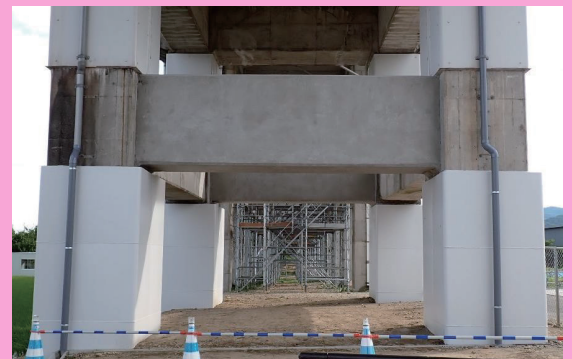
RC柱部材の軸方向鉄筋にフレア溶接継手を配置して復旧した鉄道RCラーメン橋台

セメント・コンクリート No.925 3月号 2024(令和6)年3月15日発行