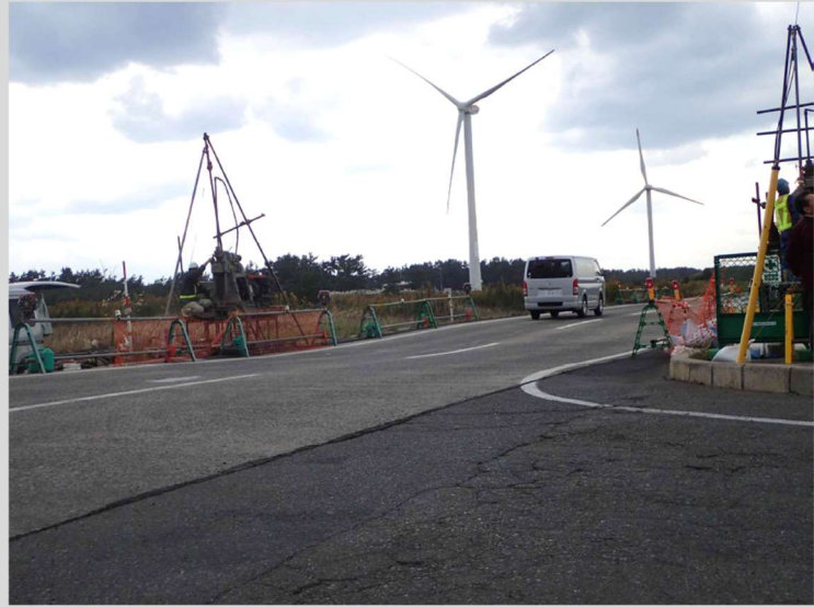
鳥取県中部地震(震度 6 弱)で被災した国道 9 号北条パイパスの連続鉄筋コンクリート舗装 (側道のアスファルト舗装は 10cm 以上の段差が発生した)