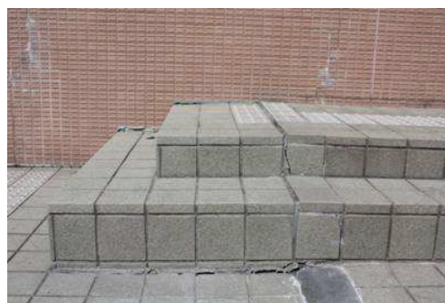
写真③ 屋外階段の不同沈下