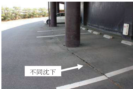
写真④ 駐車場の不同沈下