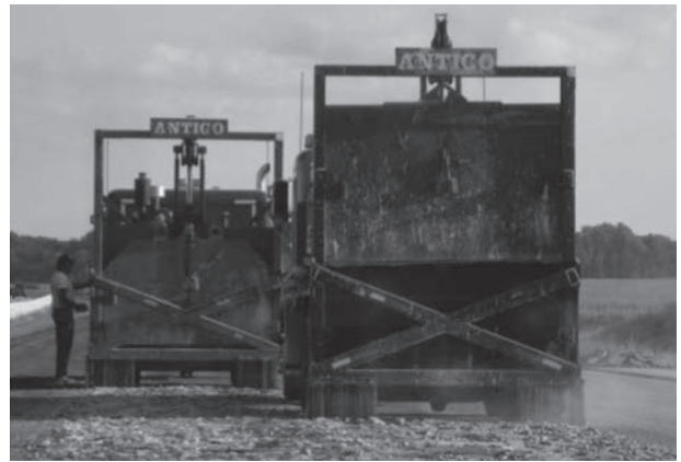
写真3 既設CRCPのギロチン型機械による破碎