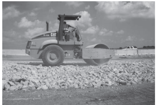
写真4 破碎コンクリート版を用いた路盤材のローラによる締固め

(写真1)。1991年に事前鉄筋表面処理プログラムが導入され、現在はこの問題は減少した。