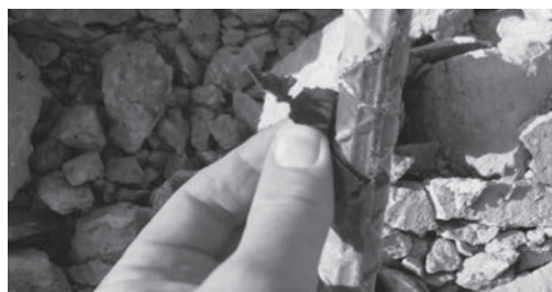
写真1 鉄筋の表面処理が不十分のため樹脂の付着が不十分